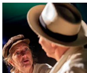
Sorbas & Basil