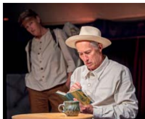
Sorbas & Basil in der Kneipe

"Hey Chef, hast du jemals etwas so schön zusammenkrachen gesehen?" Und die Genderfrage? Bei uns so gelöst, dass Frau Mann spielt und Mann Frau und Mann Mann und Frau Frau.