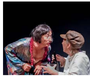
Madame Hortense & Sorbas

Bei uns so gelöst, dass Frau Mann spielt und Mann Frau und Mann Mann und Frau Frau.