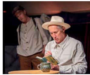
Sorbas & Basil in der Kneipe