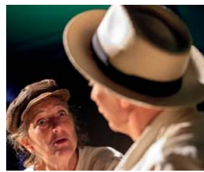
Sorbas & Basil