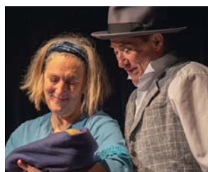
Der Murkel ist da!

Emma Mörschel, genannt Lämmchen Johannes Pinneberg