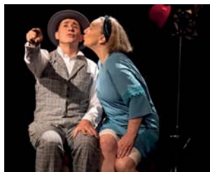
Der erste Kuss

Nach den wilden 20ern kam der Absturz der 30er. Eingebettet in die sorgenvolle Beziehung des Paares entwickelt sich eine buffoneske Außenwelt, die die beiden gängelt. Die einzelnen Etappen des Abstiegs des Buchhalters Pinneberg und seiner Frau werden durch die Begegnungen mit grotesk-komödiantischen Figuren konterkariert.