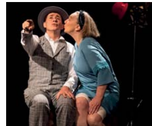
Der erste Kuss