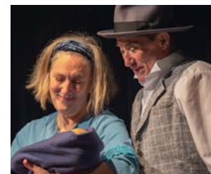
Der Murkel ist da!